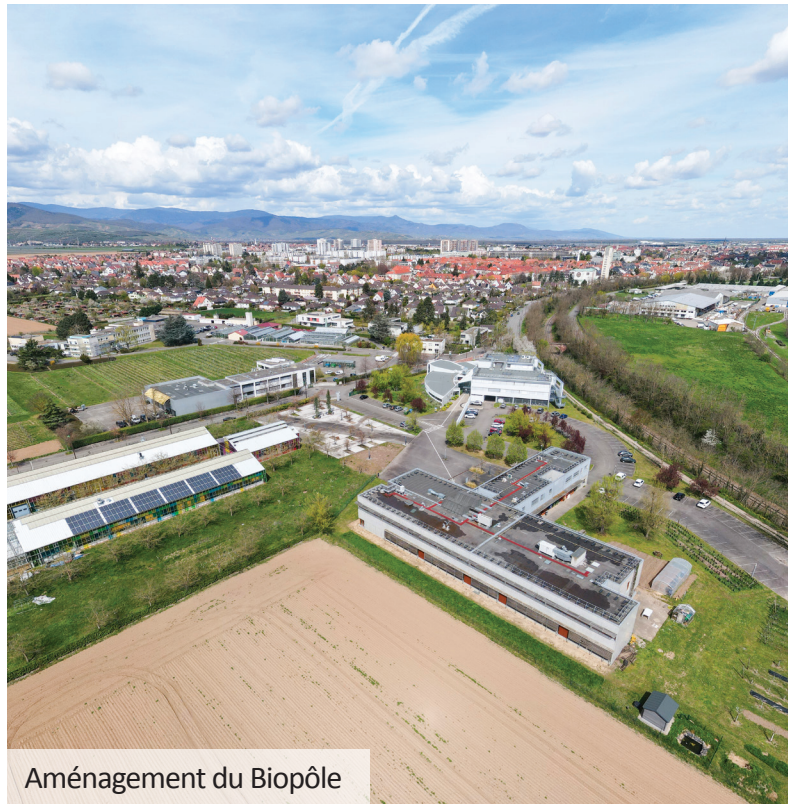
Aménagement du Biopôle