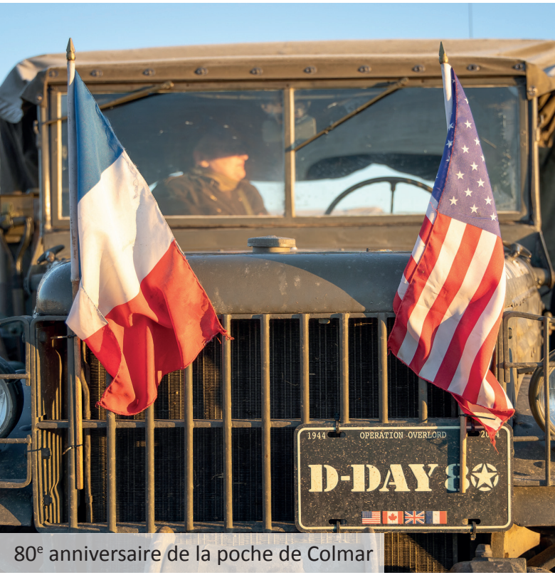
80 e anniversaire de la poche de Colmar