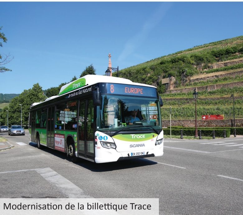
Modernisation de la billetterie Trace