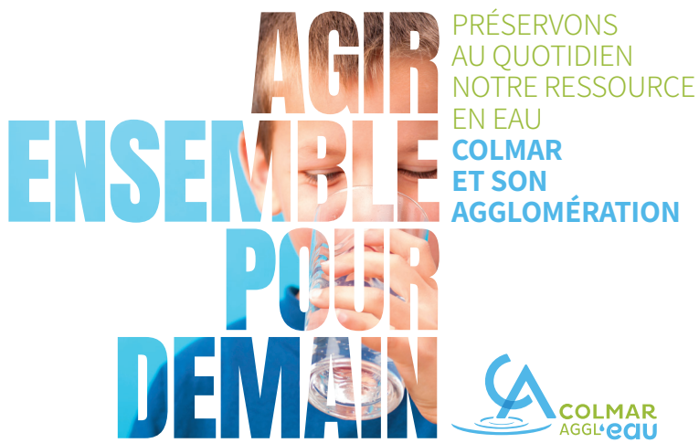
Poursuite du contrat de territoire eau et climat (CETC)