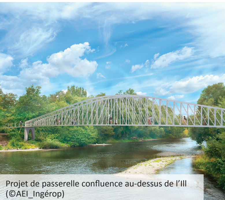
Projet de passerelle confluence au-dessus de l'III