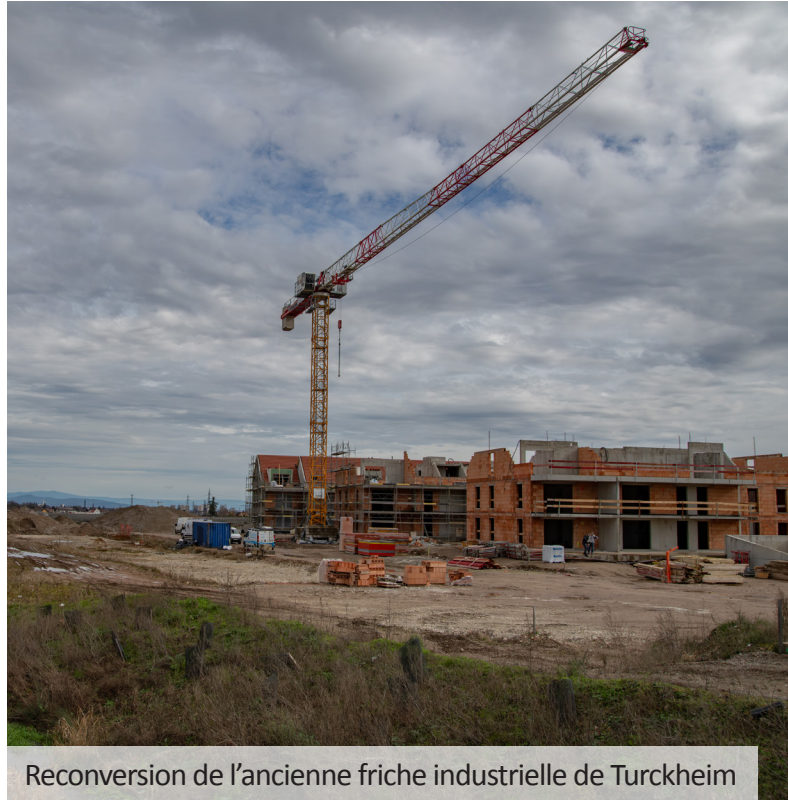
Reconversion de l'ancienne friche industrielle de Turckheim