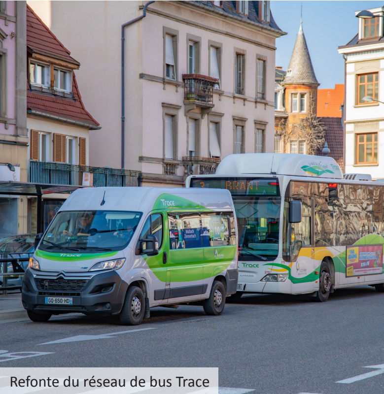
Refonte du réseau de bus Trace