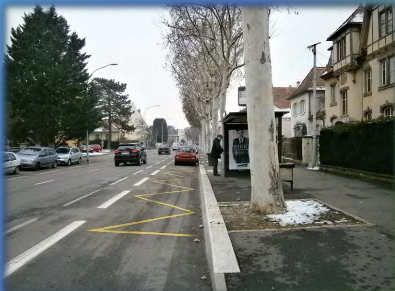
Mise en accessibilité des arrêts de bus