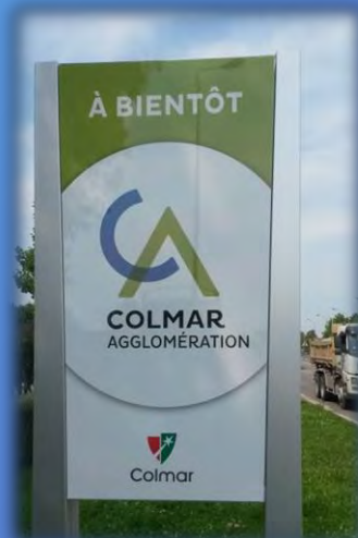
Panneaux signalétiques (entrée de l'Agglomération)